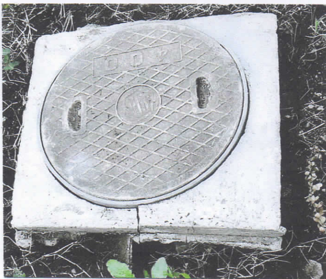
コンクリート縁 破損 穴があいた状態(2)