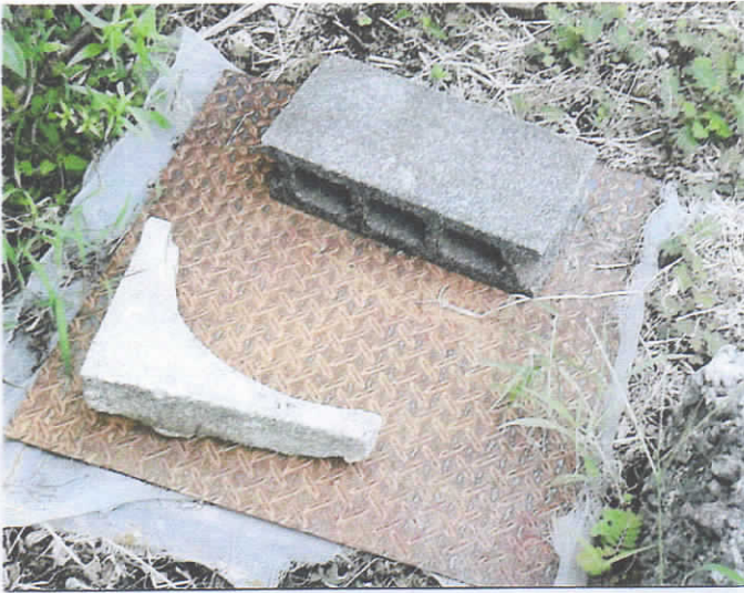
蓋破損 仮蓋取付状態