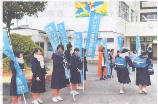
小中合同あいさつ運動

皆さんで良い小学校生活と卒業式を作り上げて、愛鷹中学校に入学してきてください。楽しみにしています。